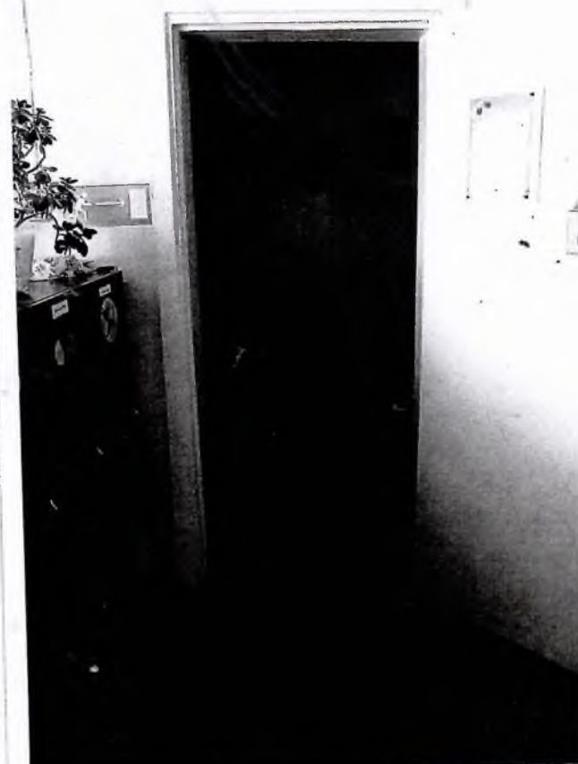
№4 дверь входная в группу 39